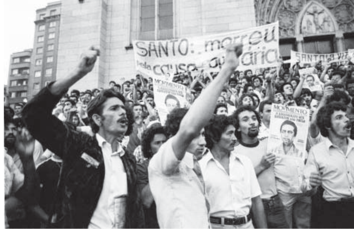
No dia 31 de outubro de 1979, mais de 30 mil pessoas saíram às ruas de São Paulo para acompanhar o enterro de um metalúrgico assassinado pela PM no dia anterior. Foi a primeira grande manifestação de trabalhadores paulistanos contra a ditadura militar que há 15 anos mandava no País.

Iahweh disse: “Eu vi, eu vi a miséria do meu povo que esta no Egito. Ouvi o seu clamor por causa dos seus opressores; pois eu conheço as suas